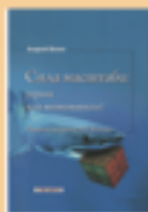
Визик А. Сила масштаба: угроза или возможность? Стратегия роста A.T.Kearney. М.: Группа ИДТ, 392 с.

Я сомневаюсь, что «масштаб для компании начинает играть более важную роль, чем производительность, качество, новые продукты и услуги или скорость их вывода на рынок».